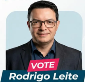
Candidato ao Conselho Fiscal