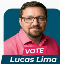
Candidato ao Conselho Deliberativo

Agradecemos a todos os eleitores que participaram das eleições e a todos os sindicatos pelo apoio, mobilização e esforço conjunto que fizeram essa conquista possível.